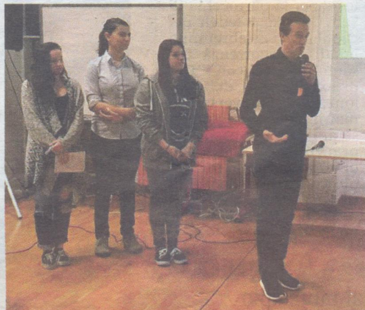
COMMON GOODS I ragazzi che hanno presentato i progetti di alternanza scuola-lavoro nell'aula magna dell'istituto «Greppi» alla presenza di studenti, professori e genitori